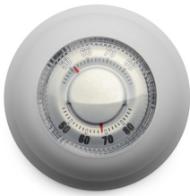
Bộ điều nhiệt