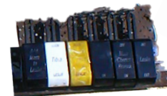
Manómetros para órganos de tubos