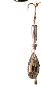
Isca de pesca