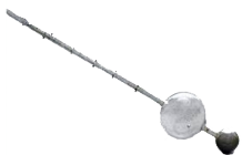
Dispositivos de medição