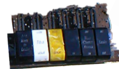
Amyonòm ki gen Tib